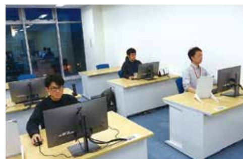
事務所内 風景(現在3名在籍中(2名が研修終了))