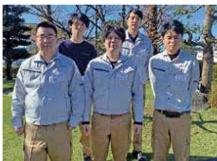
現在8名が在籍中(内5名が岐阜で研修中)