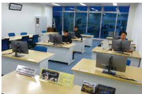
事務所内 全体風景