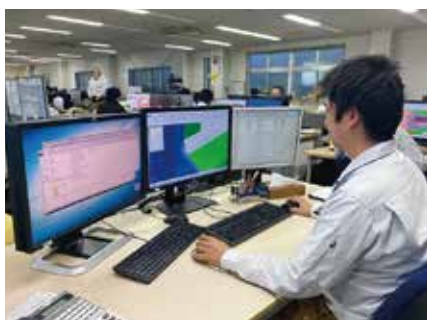
三次元(3D)設計データ作成工程

顧客から支給された完成品データ(図①)を基に最先端の三次元CADシステムとCADソフトウェアを用いて、蓄積された樹脂成型の高度なノウハウと経験に基づき、コンピュータ上で数百点から数千点になる金型構成部品とそれらを組み立てた完成品の三次元金型の設計(図②)を行います。